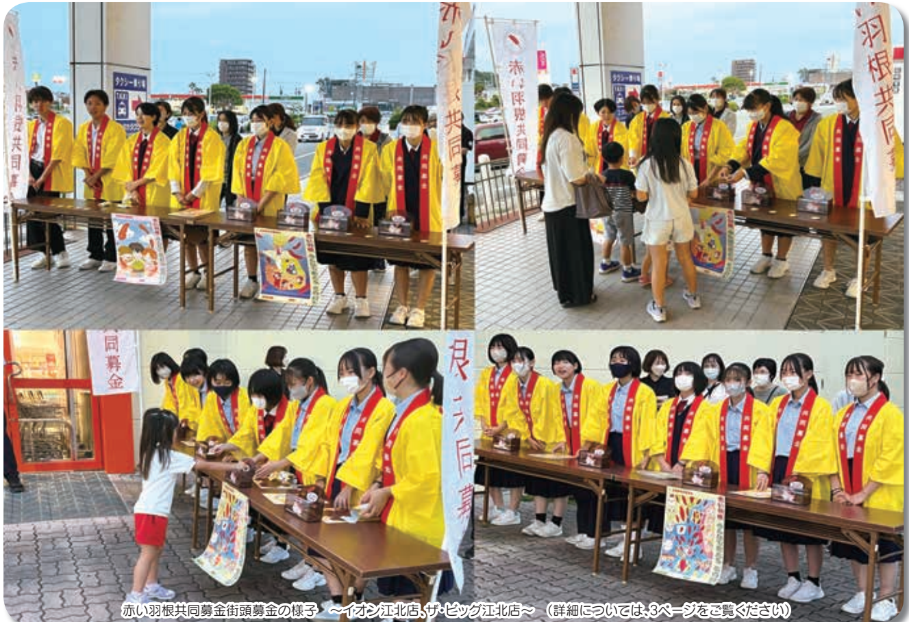
赤い羽根共同募金街頭募金の様子 ～イオン江北店、ザ・ビッグ江北店～ (詳細については、3ページをご覧ください)

編集・発行 社会福祉法人 江北町社会福祉協議会 〒849-0501 佐賀県杵島郡江北町大字山口2637番7 TEL 0952 (86) 4317 FAX 0952 (86) 3845 E-Mailアドレス kouhoku-s@kouhoku-syakyo.com