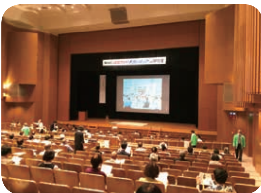
ボランティア研修会