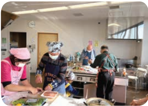
男性のための料理教室