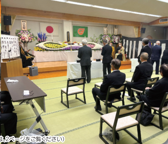
江北町戦没者慰霊祭の様子(詳細については、2ページをご覧ください)