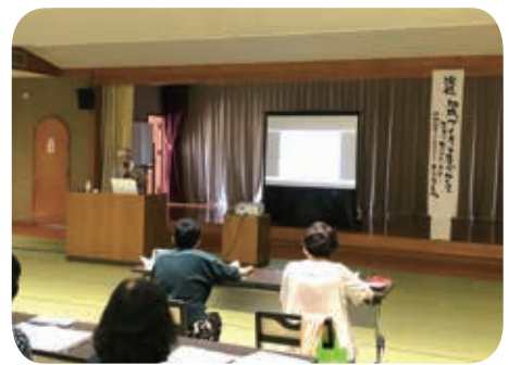
ボランティア講座・講習会