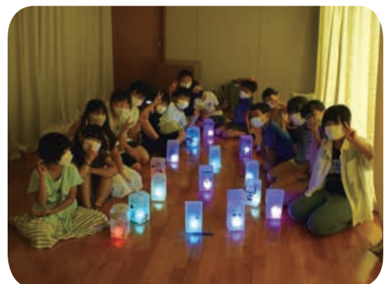
夏休み子どもサロン