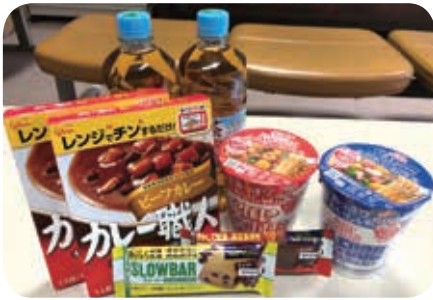
生活応援事業(フードバンク事業)